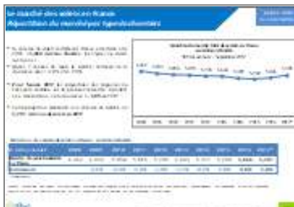
Evolution du marché