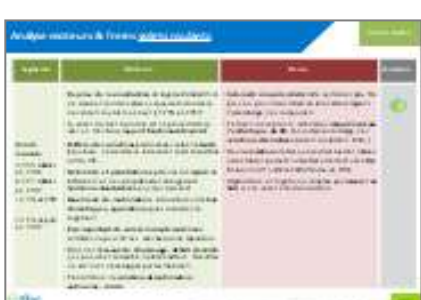
Opportunités-Menaces par débouché