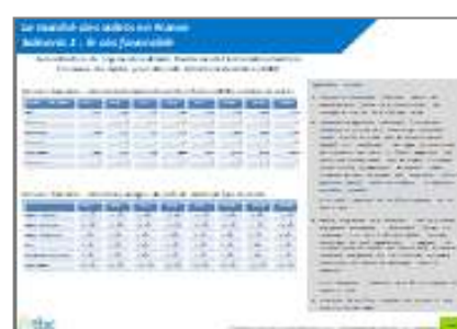
Scénarios et projections 2022